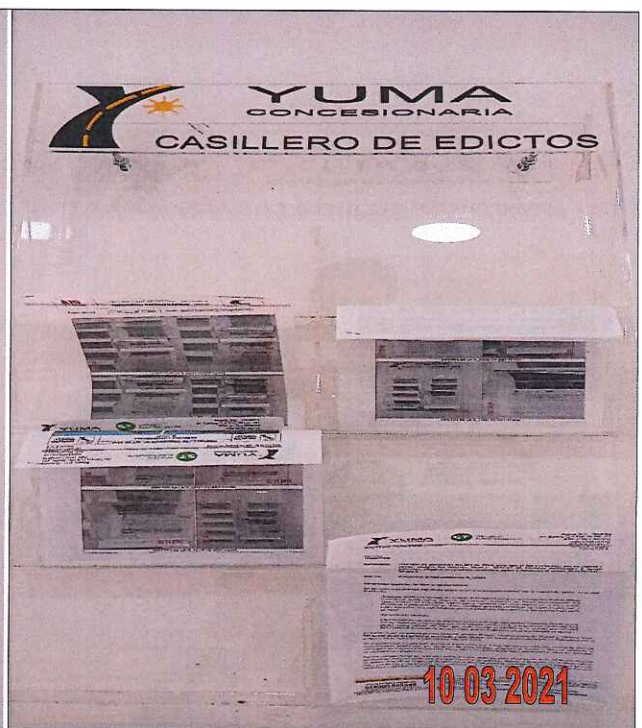
EDICTOS DE LA R_33401 YC-CRT-112259